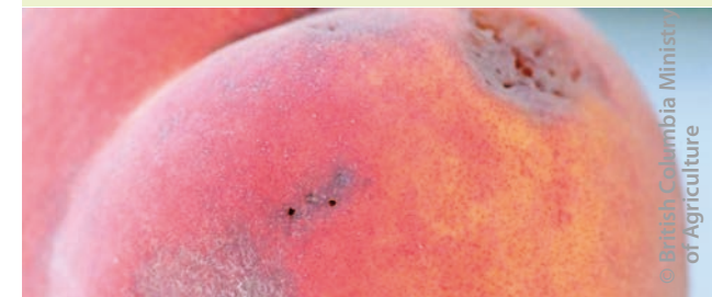
Schaden an Pfirsich