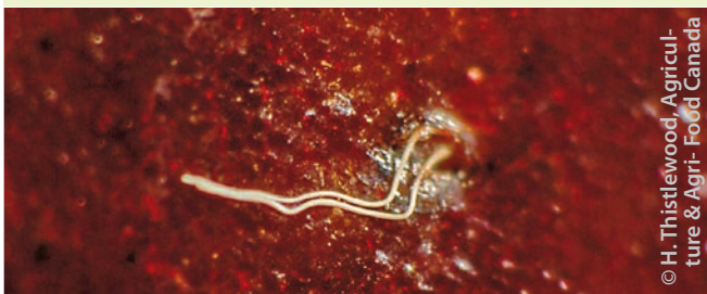
Eifäden aus einer Kirsche herausragend