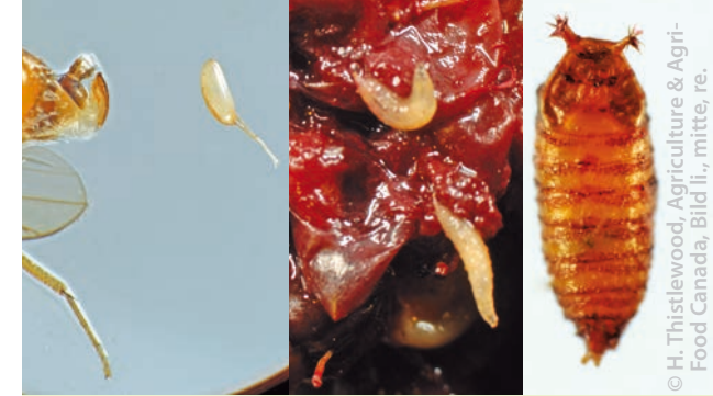
Ei, Larve, Puppe