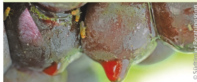
Schaden an Trauben

Außerdem nutzt die Art zahlreiche weitere Wirtspflanzen wie z. B. Mahonie, Rosen (Hagebutten), Heckenkirsche, Hartriegel, Maulbeere. In den Alpen wurde sie auf über 1000 Meter Höhe an den Früchten einer Kreuzdorn-Art gefunden.