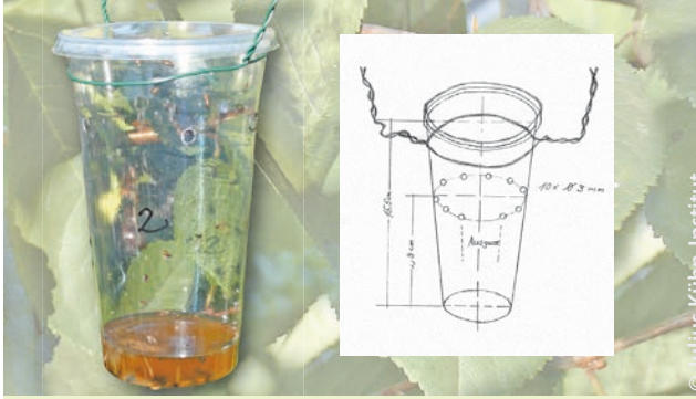
Beispiel einer Falle